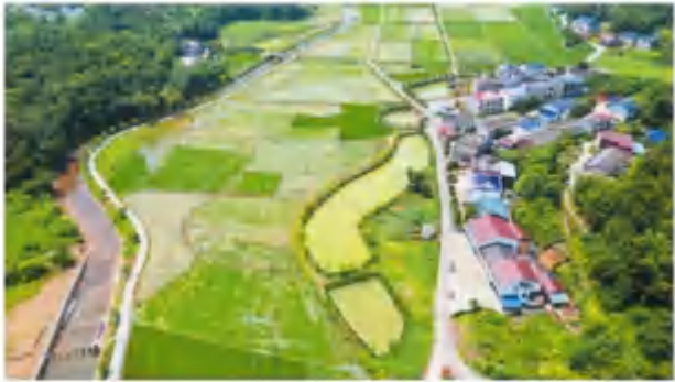
经过综合治理,浏阳大河冲村生态环境焕然一新。长沙晚报全媒体记者 曹林林 摄

据了解,2022年,浏阳市启动了水土保持小流域治理示范建设项目,旨在通过水土保持小流域治理,改善农村生态环境,提高农村生活水平。项目采取“政府主导、企业参与、村民受益”的模式,通过建设水土保持设施,改善农村生态环境,提高农村生活水平。