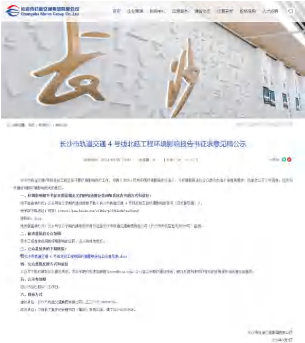
图 2 征求意见稿网上公示截图