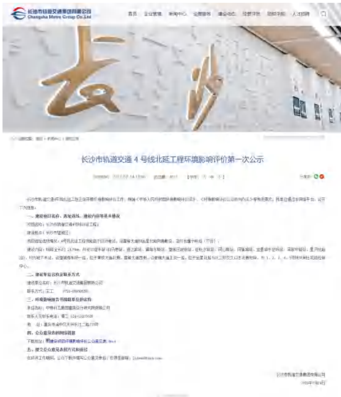
图 1 环境影响评价第一次公示截图

2023年7月14日，我公司在网络平台（ http://www.hncsmtr.com ）进行了环境影响评价信息公开，该网站为长沙市轨道交通集团有限公司官方网站，易于公众获取信息，符合《环境影响评价公众参与办法》要求。公示截图如下。